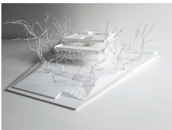
Maketa predvidene prenove objekta »Nama« z zunanjo ureditvijo