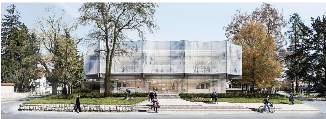
Pogled na vzhodno fasado nove knjižnice Ivana Tavčarja