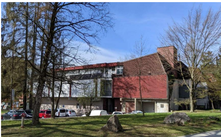
Pogled na obstoječi prizidek objekta »Nama« iz severovzhodne strani