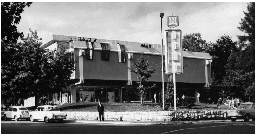
Pogled na objekt »Nama« po izgradnji prvotnega dela in terasne etaže.