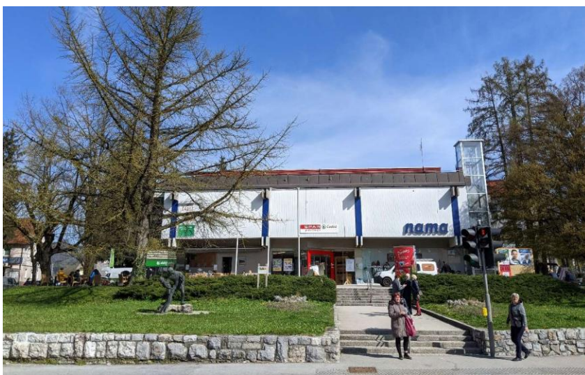
Pogled na obstoječi objekt »Nama« iz južne strani